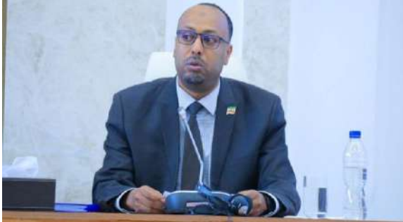
የውጭ ግንኙነት እና የሰላም ጉዳዮች ቋሚ ኮሚቴ ምክትል ሰብሳቢው የተከበሩ ዶ.ር. ፈትሂ ማሕዲ፣ ረቂቅ ስምምነቶቹን ባቀረቡበት ወቅት፤

ሌላው በዚያው መደበኛ ስብሰባ በምክር ቤቱ የጸደቀው የአየር አገልግሎት ረቂቅ ዐዋጅ፣ በኢትዮጵያ እና በኢስዋቲኒ መንግስታት መካከል የተደረገው ስምምነት ሲሆን፤ ያለ በረራ ድግምግምሽ ገደብ የጭነት በረራዎችን ማከናወን ጨምሮ ለበረራ የሚያስፈልጉ ቁሳቁሶችን ከጉምሩክ ቀረጥ ነፃ ማስገባትን የሚያካትት በመሆኑ የበረራ ወጪን እንደሚቀንስ የተከበሩ ዶ.ር. ፈትሂ ማሕዲ የረቂቁን የውሳኔ ሐሳብ ሲያቀርቡ መናገራቸው ተጠቅሷል። የምክር ቤቱ አባላትም፣ ረቂቁን ዐዋጅ ቁጥር 1420/ 2018 አድርገው በሙሉ ድምጽ ማጽደቃቸውን ከምክር ቤቱ የተገኘው መረጃ ያሳያል።