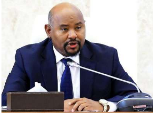
የኢኮኖሚክስ እና ቴክኖሎጂ ሚኒስቴር ሚኒስትሩ ዶ.ር. በለጠ ሞላ፣ የተቋማቸውን ሪፖርት ባቀረቡበት ወቅት፤