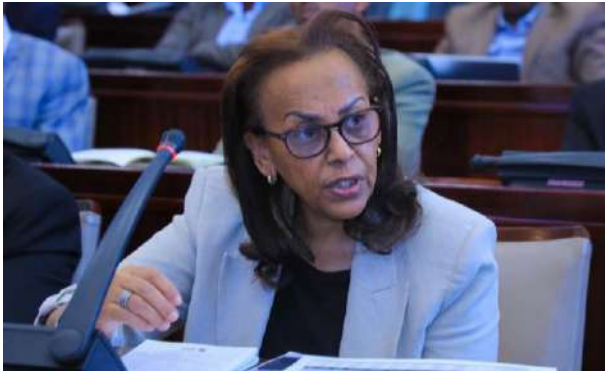
የኢትዮጵያ ብሔራዊ ምርጫ ቦርድ ሰብሳቢዋ ወ/ሮ ሜላትወርቅ ኃይሉ፣ በመድረኩ ላይ በተገኙበት ወቅት፤

የኢትዮጵያ ብሔራዊ ምርጫ ቦርድ ሰብሳቢዋ ወ/ሮ ሜላትወርቅ ኃይሉ በበኩላቸው፣ ቦርዱ ካለበት ክፍተኛ የሥራ ጫና አንጻር እያስመዘገበ ያለውን ስኬት ያስረዱ ሲሆን፣ የበጀት አፈጻጸሙም አኹን ላይ 90 በመቶ መድረሱን ጠቅሰው፣ በሚሊዮን የሚቆጠሩ የምርጫ አሥፈጻሚዎችን በማሰማራት፣ የምርጫ ቁሳቁሶችን በማጓጓዝ፣ እንዲሁም ለፖለቲካ ፓርቲዎች የሚገባውን ድጋፍ በማመቻቸት ቦርዱ ለዲሞክራሲያዊ ሂደቱ ስኬት በትኩረት እየሰራ መሆኑን አስገንዝበዋል ተብሏል።