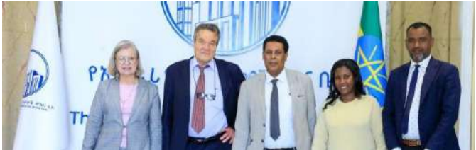
የውጭ ግንኙነት እና የሰላም ጉዳዮች ቋሚ ኮሚቴ አባላቱ፣ ከፊንላንድ ፓርላማ አባላት እና ከአምባሳደሩ ጋር በተወያየበት ወቅት፤

በዲጅታላይዜሽን ዘርፍ፣ በቴሌ-ኮሙዩኒኬሽን እና በሶላር ኢነርጅ በትብብር እየሰራች መሆኑን ጠቁመው፣ በቀጣይም ይኸንን አጠንክራ እንደምትቀጥል ተናግረዋል ተብሏል።