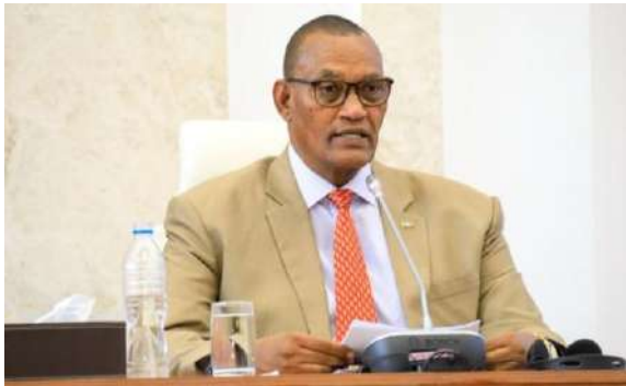
የግብርና ጉዳዮች ቋሚ ኮሚቴ ሰብሳቢው የተከበሩ ሰለሞን ላሌ፣ በዐዋጁ መጽደቅ ወቅት፤

ትርፋማ አንዲሆኑ ለማስቻል አንዲኹም ጠንካራ የውስጥ አመራር እና የአሥተዳደር ሥርዓትን ለመዘርጋት አንደሚያግዝ ገልጸዋል ተብሏል። የተከበሩ ሰለሞን፣ በማኅበራት ውስጥ የሴቶችን የአመራርነት ተሳትፎ በተመለከተ ቁጥራቸው የሚፈቅድ አባል ሴቶች በሚገኙባቸው ማኅበራት ላይ ተግባራዊ የሚደረግ መሆኑንም ጠቁመዋል። በመጨረሻም ምክር ቤቱ የኅብረት ሥራ ማኅበራት ማሻሻያ ረቂቅ ዐዋጁን፣ ዐዋጅ ቁጥር 1416/2018 አድርጎ በሙሉ ድምፅ አፅድቆታል።