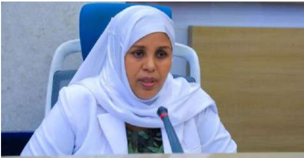
የንግድ እና ቱሪዝም ጉዳዮች ቋሚ ኮሚቴ ሰብሳቢዋ የተከበሩ አሻ ያሕያም፣ የኢትዮጵያ ኢንቨስትመንት ኮሚሽን ሪፖርት በቀረበበት ወቅት፤

የኢትዮጵያ ኢንቨስትመንት ኮሚሽን ዋና ኮሚሽነር ዶ.ር. ዘለቀ ተመስገን በበኩላቸው፣ ኮሚሽኑ ለሥራ ማነቆ የሆኑ ዐዋጆችን በማሻሻል፣ አሰራርን የሚያሳልጡ አዳዲስ ዐዋጆችን በምክር ቤቱ በማፀደቅ ምቹ እና ተገማኝ የመዋዕለ-ንዋይ ከባቢን መፍጠር እንደተቻለ አብራርተዋል ተብሏል። በዘጠኝ ወራት ውስጥ የውጭ ቀጥተኛ መዋዕለ-ንዋይን በመሳብ 3.521 ቢሊዮን ዶላር ገቢ መገኘቱን ያነሱት ኮሚሽነሩ፣ ኢትዮጵያ በምሥራቅ አፍሪካ ብሎም በአፍሪካ ቀዳሚ የውጭ ቀጥተኛ የመዋዕለ-ንዋይ መዳረሻ ለመሆን በርካታ ሥራዎች እየተከናወኑ መሆናቸውን ለቋሚ ኮሚቴው አባላት ነግረዋቸዋል።