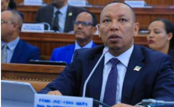
በምክር ቤቱ የመንግስት ዋና ተጠሪ ሚኒስትሩ የተከበሩ ዶ.ር. ተስፋዬ በልጅጌ፣ የብድር ስምምነቶቹን ሲያብራሩ፤

ሚኒስትሩ፣ ብድሩ ከወለድ ነጻ እና የዐሥር ዓመት የችሮታ ጊዜን ጨምሮ በ40 ዓመታት ጊዜ ውስጥ ተከፍሎ የሚጠናቀቅ መሆኑን መናገራቸው ተጠቅሷል። ምክር ቤቱም፣ የብድር ስምምነቱን ዐዋጅ ቁጥር 1423/2018 ሲል በሙሉ ድምጽ አጽድቆታል።