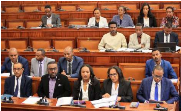
የፌዴራል ጠቅላይ ፍርድ ቤት ፕሬዝዳንት ቴዎድሮስ ምህረት፣ የከፍተኛ ፍርድ ቤት ፕሬዝዳንት ሌሊሴ ደሳለኝ እና ባልደረቦቻቸው በመደረኩ ላይ በተገኙበት ወቅት፤

መቻሉ፣ የፋይናንሺያል አፈጻጸሙ 87.8 በመቶ መሆኑ፣ የፊዚካል አፈጻጸሙ ያለበት ደረጃ የተሻለ መሆኑን አንዲ ጉም የቀረቡት የ2019 በጀት ዓመት የበጀት ጥያቄዎች ከፍ ያሉበትን ምክንያት በዝርዝር ማቅረብ መቻሉ በጥንካሬ የሚወሰዱ መሆናቸውን መጥቀሳቸውን ከምክር ቤቱ የተገኘው መረጃ ጠቅሷቸዋል።