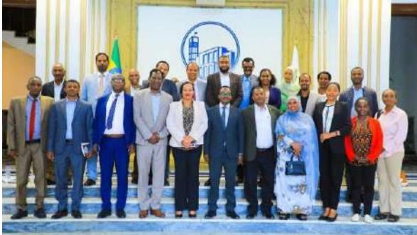
የኢፌድሪ የሲቪል ማኅበራት ድርጅቶች ባለሥልጣን አመራሮች እና የሕግ እና ፍትሕ ጉዳዮች ቋሚ ኮሚቴ አባላት

ከምክር ቤቱ እንደተገኘው መረጃ ከሆነም፣ በሰባተኛው አገራዊ ምርጫ የሚሳተፉ ሀገር በቀል የሲቪል ማኅበረሰብ ድርጅቶች በሚያደርጉት እንቅስቃሴ፣ ነጻነታቸው እና ገለልተኝነታቸው ላይ ጥያቄ ሊነሳባቸው እንደሚገባ ቋሚ ኮሚቴ ማሳሰቡ ተጠቅሷል።