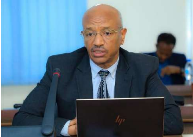
የኢትዮጵያ አደጋ ስጋት ሥራ አመራር ኮሚሽን ኮሚሽነር አምባሳይሮ ዶ.ሮ. ሸፈራው ተክለ ማርያም፣ የተቋማቸውን ሪፖርት ባቀረቡበት ወቅት፤

የኢትዮጵያ አደጋ ስጋት ሥራ አመራር ኮሚሽን ኮሚሽነር አምባሳይሮ ዶ.ሮ. ሸፈራው ተክለ ማርያም በበኩላቸው፣ የአደጋ ስጋት ሥራ አመራር ፈንድ በብሔራዊ ባንክ እና ንግድ ባንክ አካውንት ተከፍቶለት ፈንድ የማሰባሰብ ምዕራፍ ላይ እንደሚገኝ ጠቅሰው፣ ከየካቲት 1/2018 ዓ.ም. ጀምሮ ማሰባሰብ በተጀመረው በዚህ ፈንድ፣ በአንድ ወር ወስጥ ከ 1.7 ቢሊዮን ብር በላይ ማሰባሰብ መቻሉን ተናግረዋል። ከዚያ ባለፈው፣ በክልሎችም ባለፉት ዘጠኝ ወራት ከ10 ቢሊዮን ብር በላይ ማሰባሰብ መቻሉንም አክለውም መጥቀሳቸውን ከምክር ቤቱ የተገኘው መረጃ ይጠቁማል።