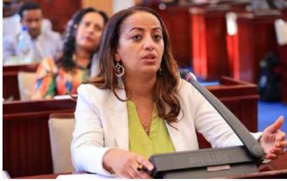
የጤና ሚኒስቴር ሚኒስትሯ ዶ.ር. መቅደስ ዳባ፣ የሚኒስቴር መሥሪያ ቤታቸውን ሪፖርት ሲያቀርቡ፤