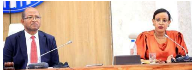
የአንደራሴዎቹ ምክር ቤት አፈ ጉባኤ የተከበሩ ታገሰ ጫፎ እና የተሪዝም ሚኒስቴር ሚኒስትሯ ሰላማዊት ካሣ፣ በሪፖርቱ ወቅት፤

300 ያላነሱት በተመጣጣኝ ወጪ በአጭር ጊዜ ውስጥ መልማት እንደሚችሉ በጥናት መለየቱን ለአንደራሴዎቹ አስረድተዋቸዋል።