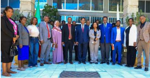
ቋሚ ኮሚቴው፣ የኮተቤ የትምህርት የገቢ ሰጪ ቤትን በጎበኝባት ወቅት፤

የተጀመሩትን የልማት ዕቅዶች አጠናክረው እንደሚያስቀጥሉ ገልጸዋል ተብሏል።