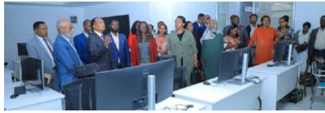
ቋሚ ኮሚቴው፣ የትራንስፖርት እና ሎጂስቲክስ ሚኒስቴርን በጎበኘበት ወቅት፤

የትራንስፖርት እና ሎጂስቲክስ ሚኒስትሩ የተከበሩ ዶ.ር. ዓለሙ ስሜ በበኩላቸው፣ አሁን በተከሰተው ዓለም ዓቀፋዊ ሁኔታ በተከሰተው የነዳጅ አቅርቦት ምክንያት የትራንስፖርት ዘርፉ ችግር አንደገጠመው ጠቅሰዋል። ሚስትሩ አክለውም፣ አኹን ላይ የትራንስፖርት ዘርፉ አንዳይቋረጥ ሚኒስቴር መሥሪያ ቤቱ ልዩ ኮማንድፖስት ዐዋቅሮ ሰፊ ሥራ እየሰራ መሆኑንም በአዚያ ላገኛቸው የቋሚ ኮሚቴው አባላት አንስተውላቸዋል ተብሏል።