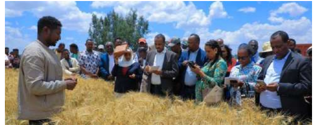
ቋሚ ኮሚቴው፣ በሸገር ከተማ የመስክ ጉብኝት ወቅት፤

የተጀመሩትን የልማት ዕቅዶች አጠናክረው እንደሚያስቀጥሉ ገልጸዋል ተብሏል።