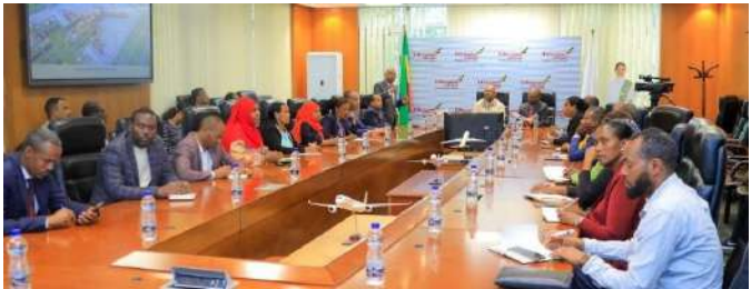
ቋሚ ኮሚቴው፣ በኢትዮጵያ አየር መንገድ ጉብኝት ወቅት፤

በአቪዬሽን፣ በንግድ እና በኢኮኖሚ ዘርፍ ያላትን ትልቅ አቅም ይዞ ወደ ቀጣይ የዕድገት ምዕራፍ ለመሻገር የሚያስችል መሆኑን ተናግረዋል ተብሏል። ከቦታው የተነሱ አርሶ አደሮችን መልሶ ለማቋቋም የታቀዱ አቅዶች ተቋሙን የሚመጥኑ መሆናቸውን አክለው ያነሱት ሰብሳቢው፣ አርሶ አደሮቹ በአዲሱ አካባቢ እስኪቋቋሙ ድረስም የቅርብ ክትትል እና ድጋፍ ሊደረግላቸው እንደሚገባም ማሳሰባቸው ተሰምቷል።