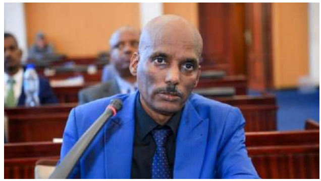
የኢትዮጵያ ልማት ባንኩ ንፊዝዳንት ዶ.ር. ኢሳያስ ካሳ፣ የባንኩን ሪፖርት ሲያቀርቡ፤

ባንኩ ማንቆ የሆኑ ፖሊሲዎችን ወይም ሊያሰሩ በሚችል መልኩ ማሻሻሉ፣ የብድር አመላላሉ የተሻለ መሆኑ፣ ከውጭ ምንዛሪ ግኝት ጋር ተያይዞ የተሰሩ ሥራዎችን እንዲኹም ሌሎች የተሻሉ ሥራዎችን በመሥራቱ የባንኩ ገቢ እየተሻሻለ መምጣቱን ሰብሳቢው በጥንካሬ ጎኑ ማንሳታቸውም ተሰምቷል። የባንኩ ንፊዝዳንት ዶ.ር. ኢሳያስ ካሳ በበኩላቸው፣ ከብድር አሰጣጥ ሂደቶች ጀምሮ ያሉትን ክፍተቶች ለመሙላት ስትራቴጂ ነድፈው እየሰሩ እንደሆነ አንስተው፣ የባንኩን መሠረታዊ ችግሮች ለመቅረፍ ያስችል ዘንድ አዲስ ቦርድ ተቋቁሞ ወደ 23 ፖሊሲዎች ፀድቀው የተለየ ክትትል በማድረግ የልማት አጋሮች ቋሚ የሆነ ፈንድ ሞብላይዜሽን በማቋቋም ሥራዎች እየተሰሩ እንደሆነ ጠቁመዋል ተብሏል።