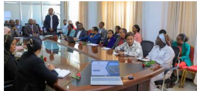
ቋሚ ኮሚቴው፣ የኢትዮጵያ የክፍያ መንገዶች ኢንተርፕራይዝን ሲጎበኝ፤