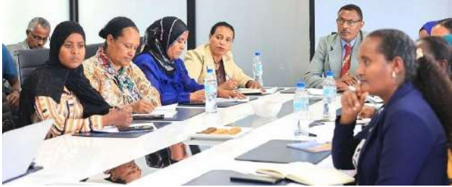
ቋሚ ኮሚቴው፣ የኢትዮጵያ ካፒታል ገበያ ባለሥልጣንን በጎበኝነት ወቅት፤

ዳይሬክተሯ ለጥቀውም፣ በ2018 በጀት ዓመት በጠንካራ የሕግ ማዕቀፍ እና የቁጥጥር ሥርዓት የሚመራ የካፒታል ገበያ እንቅስቃሴ እንዲኖር፣ ዘመናዊ የገበያ መሠረተ ልማቶች በተሟላ ሁኔታ ሥራ ላይ እንዲውሉ፣ ፈቃድ ያላቸው የካፒታል ገበያ አገልግሎት ሰጪዎች በንቃት እንዲሳተፉ እና አዳዲስ አገልግሎት ሰጪዎች ፈቃድ እንዲወስዱ እየተደረገ መሆኑንም ገልጸዋል ተብሏል።