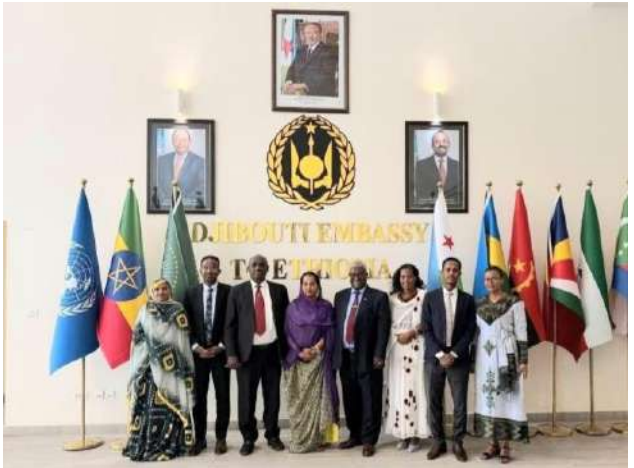
የኢትዮ-ኢጋድ እና ምሥራቅ አፍሪካ አገራት የፓርላማ ዲፕሎማሲ ቡድን፣ ከጅቡቲ አምባሳደር ተወካይ እና ከጅቡቲ ዲፕሎማቶች ጋር፤