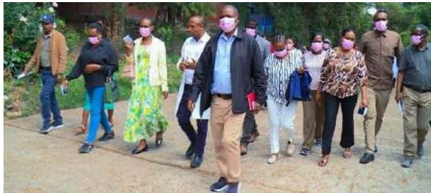
ቋሚ ኮሚቴው፣ የአዋጅ ቆይታ ፋብሪካን ሲጎበኝ፤

የአዋጅ ቆይታ ፋብሪካ ሥራ አሰጣጥ ስርዓት ወሰኑ በበኩላቸው፣ እንደ ድርጅት አካባቢን በጠበቀ መልኩ ለመሥራት ስትራቴጂ ተዘጋጅቶ እየተሰራ መሆኑን ጠቅሰው፣ ከፋብሪካው የሚወጡ ተረፈ ምርቶችን ወደ አፈር ማዳበሪያ፣ ለኬሚካል መሥሪያ እና ለሌሎችም ጥቅም ላይ በማዋል አካባቢን ለመጠበቅ የተለያዩ ተግባራት እየተከናወኑ መሆናቸውን በዚያ ላገጃቸው የቋሚ ኮሚቴው አባላት አብራርተዋል ተብሏል።