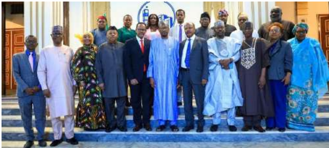
ኹለቱ ቋሚ ኮሚቴዎች፣ ከናይጄሪያ የብሔራዊ ጉባኤ አገልግሎት ኮሚሽን ጋር፤